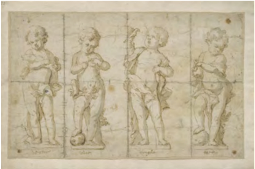
Afb. 2 De voortekening van de vier beeldjes van afbeelding 1 door J.P. van Bauscheit. Van links naar rechts water, vuur, lucht en aarde. (Prentenkabinet Antwerpen)