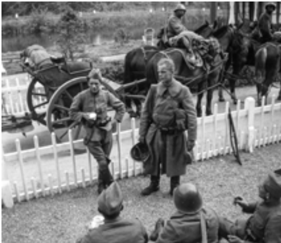
Afb. 10 Militairen van de Nederlandse bereden veldartillerie in de tuin van Vrede-Rust, 14 mei 1940.