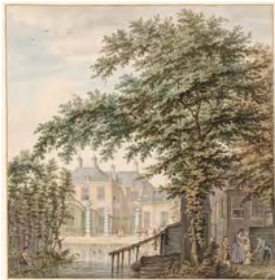
Afb. 29 De buitenplaats Luxemburg in Maarseveen rond 1780. (Aquarel 44x43 cm, papier, door Hermanus Petrus Schouten)

voorjaar op zondagmiddagen voor het publiek open is om de stinsenflora te kunnen bewonderen. In de gemeentelijke kwekerij, die nu op de buitenplaats is gevestigd staat een 17 de -eeuwse moerbeiboom, die nog door de beroemde botanicus Commelin is geplant.