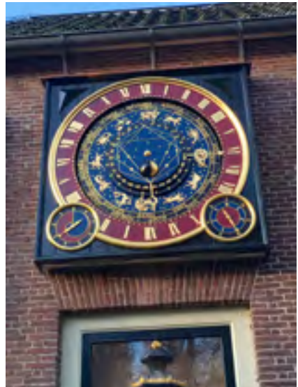
Afb. 3 De astronomische klok.