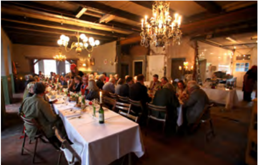
Afb. 2 Het jaardiner in De Kampioen in Nieuwersluis.