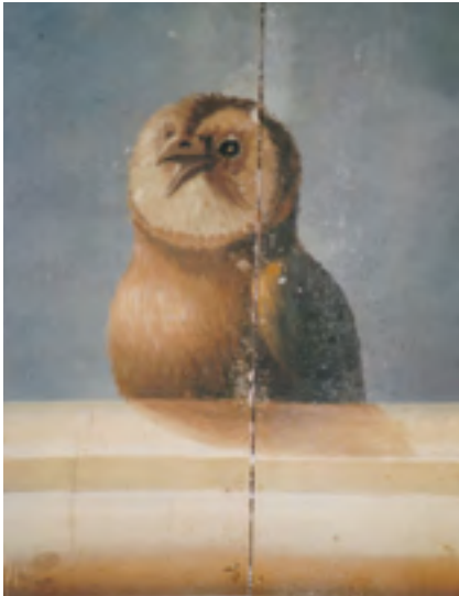
Afb. 24 Detail van 17 de -eeuwse plafondschilderingen in de hal van Raadhoven te Maarsse, Een bosuil.