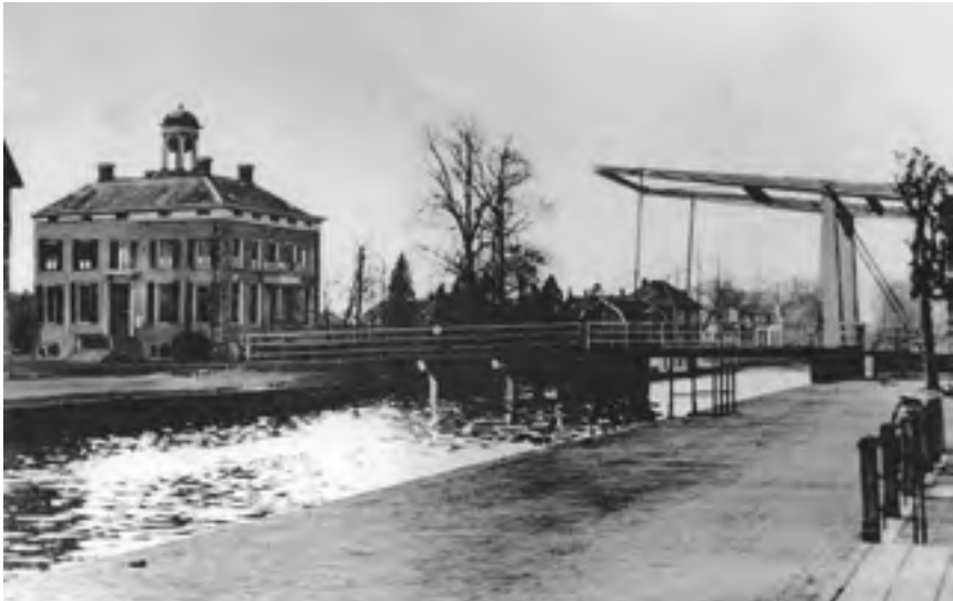
Afb. 23 Kasteel Bolenstein te Maarssen met in 1954 geplande brug over de Vecht.

Of het zeer rijke uit 1729 daterende smeedijzeren hek later is verplaatst naar de huidige plek aan het jaagpad vanaf de Diependaalsedijk is nog een open vraag. Tijdens de restauratie van het hek, die in 2005 gereed kwam, bleek dat de ijzeren letters 'ELSE' vervangen zijn door die van 'DOOR' waardoor het een Doornburgh hek werd. De smid is ruim een jaar bezig geweest om verroest ijzer te vervangen en verloren onderdelen bij te maken. Alle delen zitten met pen-en-gat en zwaluwstaartverbindingen aan elkaar en er is geen stuk gelast. Merken van de ijzerleveranciers en telmerken van bij elkaar passende onderdelen geven een indruk van het werk van de smid en hielpen ook om de datering te bepalen. De Dr. R van Luttervelt Restauratie Stichting heeft de benodigde financiën bijeen weten te brengen en het werk begeleid. Het terrein van Elsenburg , ooit 24 hectare groot, werd ingelijfd bij dat van Doornburgh dat in 1912 werd gekocht door de heer J.P. van Voorst van Beest. Hij liet het huis restaureren en vergroten door er een stuk aan de zuidzijde aan te bouwen. Uit een afgebroken huis in Groningen kwam een 18 de -eeuwse voordeurpartij, een aantal plafondschilderingen en een haardpartij. In 1957 ging de toen 10 hec-