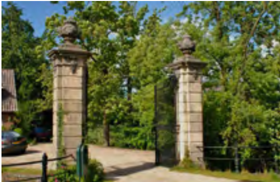
Afb. 5 Het hek van de verdwenen buitenplaats Otterspoor te Maarsse.