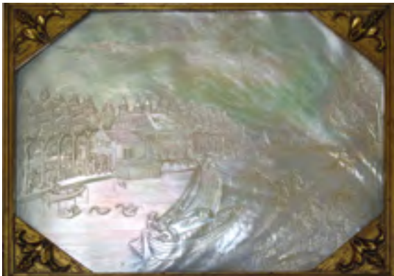
Afb. 11 Gesneden parelmoeren schelp met een afbeelding van Oostervecht. Het bevindt zich in het Vechtstreekmuseum te Maarsse. Gesigneerd 'J.B. Barkhuijzen fecit'. Afm. 11 x 14,5 cm.

Aan de rechterkant van de Rijksstraatweg lag in Loenen tot in de jaren '30 (20 ste eeuw) het buiten Rijzicht 27 tegenover de huidige Jumbo. Op dit terrein werd de nieuwe wijk van het dorp gebouwd.