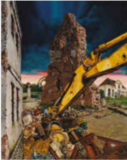
Afb. 18 De ondergang van het buiten Endelhoven te Maarsse. (Schilderij door B. Tielens)