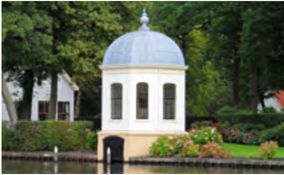
Afb. 10 Theekoepel van het verdwenen buiten Geestevecht aan het Oud Over te Loenen.