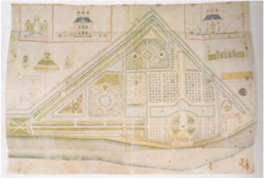
Afb. 12 Kaart van het buiten Petersburg aan de oostzijde van de Vecht tegenover Nigtevecht door Jacob Schijnvoet.

Terug naar de oostoever waar vanaf de weg naar Loosdrecht (de Bloklaan) twee buitens stonden die in de 19 de eeuw ontmanteld werden om de vergroting van het park van Vegtlust mogelijk te maken. Dat waren achtereenvolgens Langgewenst 30 en Geestevecht waarvan de koepel met het botenhuis eronder is blijven staan (afb. 10). Hetzelfde lot trof wat verder naar het noorden Beek en Vecht 31 dat bij Oud Over werd getrokken. Een kilometer verder langs het Oud Over stond Oostervecht 32 dat de bakermat werd voor de glasfabriek van Van der Mersch. Deze fabriek produceerde in de 19 de eeuw flessen voor onder meer de Weesper jeneverdistilleerderijen (afb. 11). Het naastgelegen Russenrust is eerder al afgebroken inclusief de fundamenten, zoals een akte beschrijft.