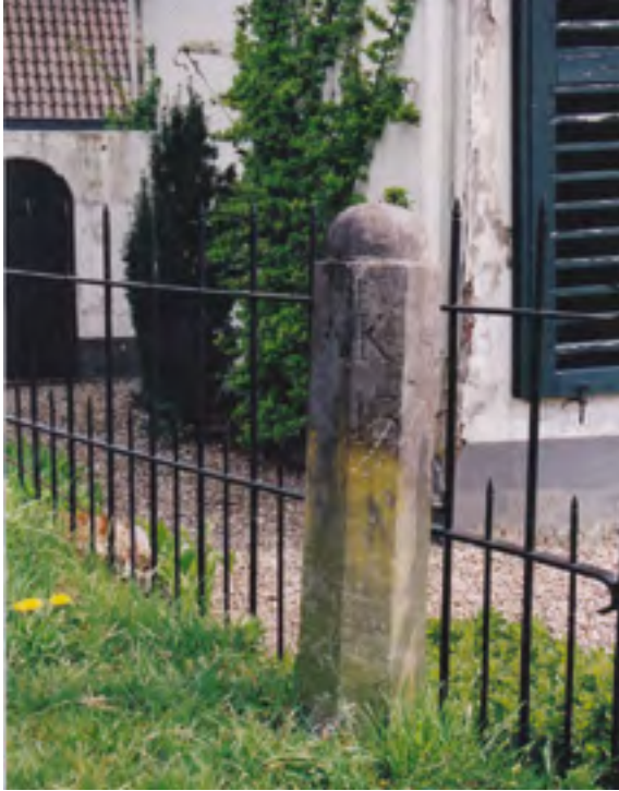
Afb. 17 Hardstenen hoefslagpaal gemerkt 'AK' en 'N13' aan het jaagpad bij Vechtoever te Maarsse.

door Huydecoper zijn gesticht in de 17 de eeuw. Behalve het huis Mariënhof , waar een van zijn dochters woonde, heeft geen van die buitens de 20 ste eeuw gehaald. Het bruggetje in het jaagpad over die vaart is een rijksmonument en vertoont soortgelijke historische elementen als de brug bij Geesbergen , maar verkeert in deerniswekkende staat. De Dr R. van Luttervelt Restauratie Stichting heeft de hulp ingeroepen van Waternet om te trachten het bruggetje te restaureren.