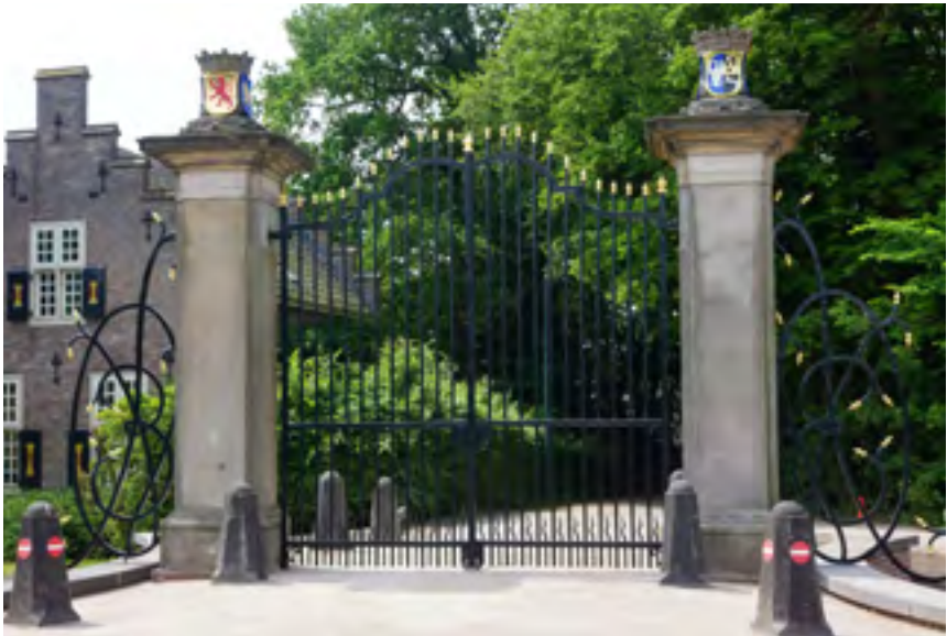
Afb. 1 Het gerestaureerde hek van Nijenrode.

Het smeedijzeren hek aan de zuidingang van Nijenrode dateert uit 1750 en stond oorspronkelijk op de plek waar nu de toegangspoort uit 1916 staat. Het