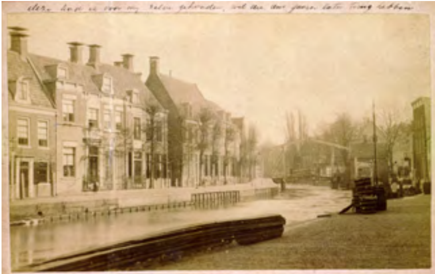
Afb. 26 Zicht op de Herengracht vanaf de Schippersgracht in Maarsse in 1875.