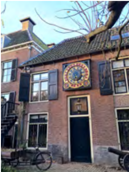
Afb. 2 De astronomische klok in de achtergevel van het koetshuis.