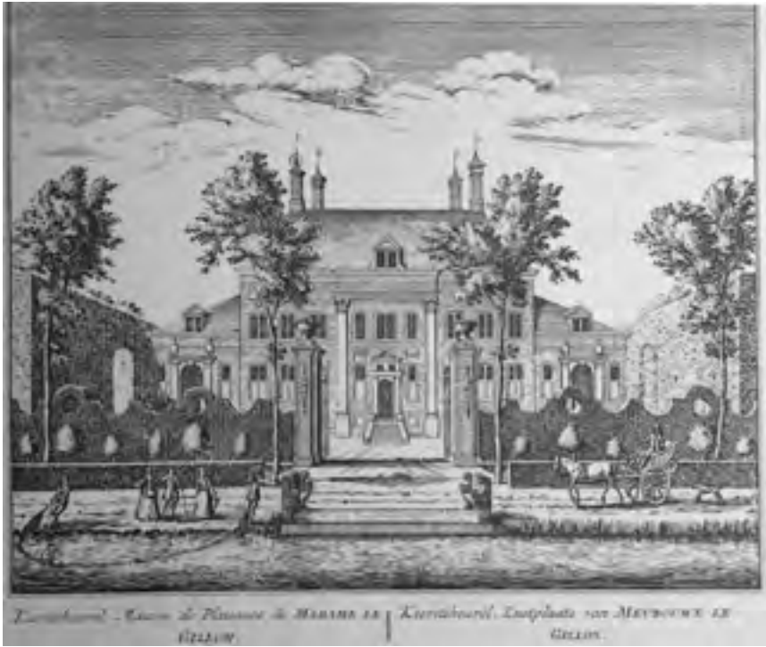
Afb. 15 Kievitsheuvel aan de Holendrecht ten noordwesten van Abcoude, plaat nr. 67 Hollands Arcadia 1730.

Het kleine Overdorp is rond 1800 waarschijnlijk vervangen door een wat groter huis aan de straat bij de brug van Baambrugge en bleef zo bestaan. De weg, een Napoleontische coupure, de hoek om vervolgens kwam Bergvliet 51 in zicht met Vrederijk daarnaast; het eerste werd door het tweede geannexeerd dat deels bleef bestaan en tot boerderij werd verbouwd. Verder gaand kwam men langs Postwijk , het 17 de -eeuwse Schaapsgift 52 en Langverzwegen-Elsbosch waar nu Lindenhof ligt. De rij buitens eindigt hier met het nu niet meer bestaande Meerleveld met daar tegenover het met een pontje bereikbare Ypenburg , dat weer een boerderij werd. Tegen Abcoude aan lagen De Koppel-Koppelrust en Blo(e)mswaard . 53 Aan de noordwestzijde van Abcoude lag Holendrecht aan de oude Rijksweg, tot 1881 de Grote weg der 1e klasse genoemd. 54 Dit werd in de