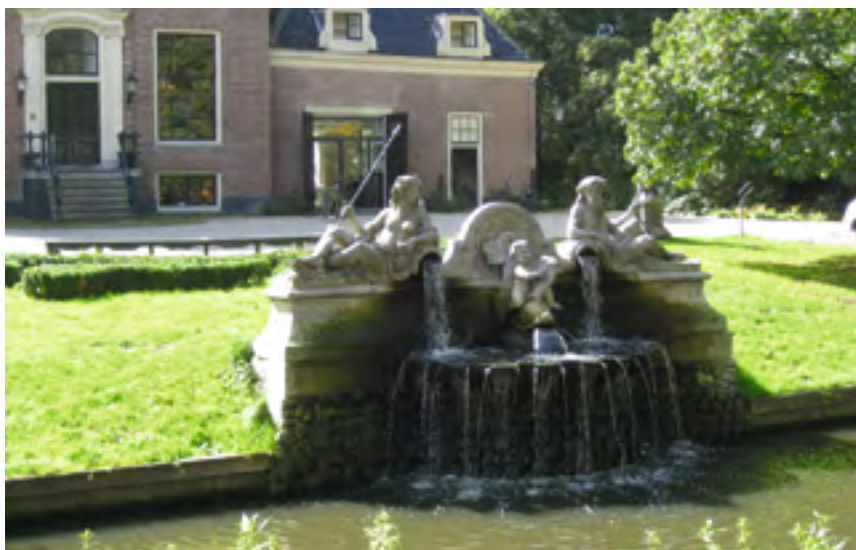
Afb. 17 De fontein van Ignatius van Logteren, 1714, afkomstig van het buiten Driemond aan de Gaasp te Weesp, nu voor het buiten Frankendael aan de Middenweg te Amsterdam.

Verdwenen buitens langs het Gein vanaf Abcoude naar de Gaasp Aan het Gein lag een aantal buitens die nu alle weer boerderijen zijn geworden of geheel verdwenen zijn. Op bijgaand kaartje (afb. 16) 58 staan hun namen. In het volgende overzicht is geпоogd de buitens van de boerderijen te scheiden. 59