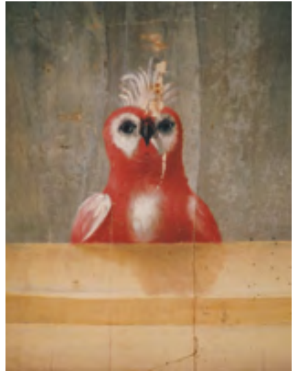
Afb. 25 Idem een papegaai. (Coll. H. van Bommel)

tare grote buitenplaats over in de handen van de Kanunnikessen van het Heilig Graf. Zij lieten in de jaren zestig het zeer eigentijdse klooster bouwen in de oude moestuin naar ontwerp van architect J. de Jong in de stijl van de Bossche school. Die was ontwikkeld door priester-architect Dom van der Laan. Aan de Vecht stond toen een nogal verwaarloosde theekoepel die overgenomen werd door architect B.O. van den Berg. Hij woonde op kasteel Bolenstein aan de overkant van de Vecht en herbouwde de koepel in zijn tuin.