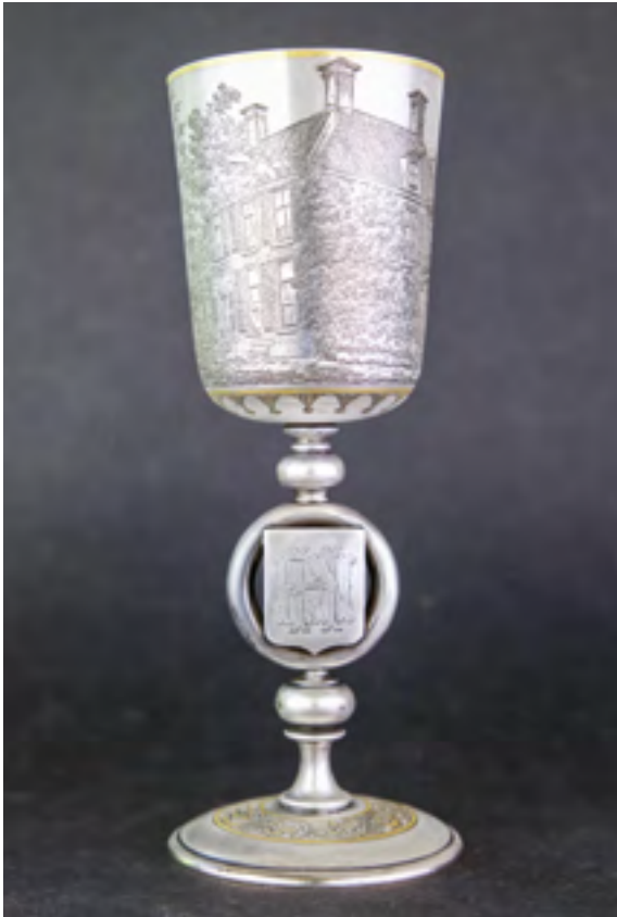
Afb. 9 Zilveren beker met gravure van Gansenhoef te Maarsse. (Coll. Lisman, foto J. Van de Water)

Vecht en Dijk , die daar stond te verkommeren. Hij dateert uit 1861 en is vervaardigd door ijzergieterij Nering Bögel te Deventer. In 1996 is de koepel gekocht door de heer Van der Wal, die hem aan het Zandpad voor zijn huis liet neerzetten en het gebouwtje restaureerde met hulp van de Dr. R. van Luttermvelt Restauratie Stichting. Dat huis was eerst het koetshuis van Gansenhoef , later sporthal van de stichting die Gansenhoef toen bezat en nu een woonhuis met de naam Midden Gansenhoef. Gansenhoef zelf werd door architect Philips Vingboons uit Amsterdam ontworpen en werd gebouwd in 1655. Daarvoor werd het bestaande huis, te zien op de gravure, afgebroken. Dat was van Geer-