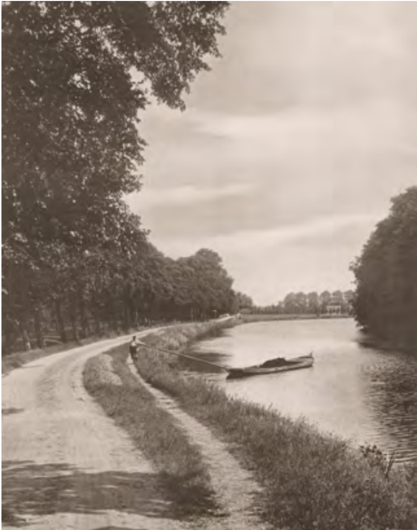
Afb. 3 Het Zandpad, nog niet geasfalteerd, vanaf het toen nog aanwezige brugje bij Oudaen in augustus 1914 met zicht op de brug over het Tienhovenskanaal. Weekblad Buiten , augustus 1914.