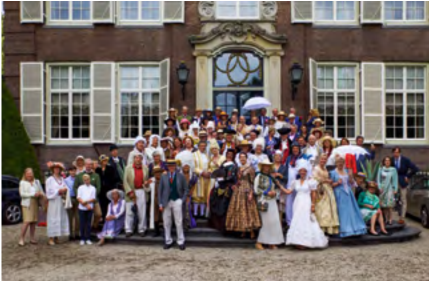
Afb. 1 Groepsfoto tijdens de LustrumLunch in 18de-eeuwse stijl op VreedeenHoff.

slepend leven, met veel reizen in open auto's, familiebijeenkomsten en tuinfeesten, maar vooral ook prachtig werk van een onafhankelijke vrouw.