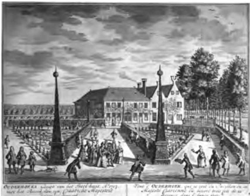
Afb. 7 Gezicht in het park van Ouderhoek te Nieuwersluis met het gevolg van Peter de Grote. Plaat nr. 49 uit De Zegepraalende Vecht 1719.

Aan de oostoever blijvend vond men in de 18 de eeuw ten noorden van Weerstein achtereenvolgens Oversticht , Lixboa , Gelderrust en het grote Hunthum 19 (eerder Sluisnae geheten). Van Lixboa is de oude boerderij gebleven met de naam op de gevel. Gelderrust werd in de 19 de eeuw opgenomen in Hunthum waarvan het circa 5 hectare grote verwaarloosde park nog bestaat. Er zijn plannen om dit buiten een nieuw leven te geven. Tegen de oostelijke fortificatie van de vesting Nieuwersluis lag aan de zuidzijde al in de 17 de eeuw de buitenplaats Schanszicht . 20