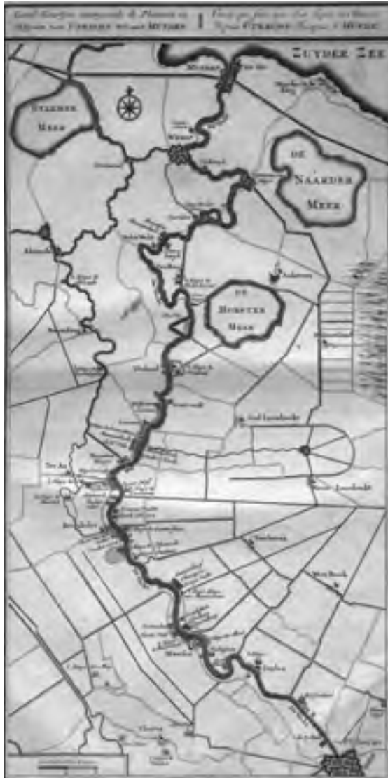
Afb. 1 Kaart van de buitens aan de Vecht uit De Zegepraalende Vecht uit 1719.