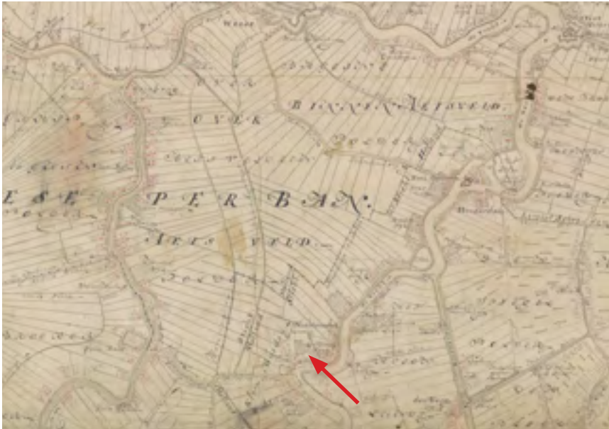
Afb. 3 Deel van de Ketelaar kaart van de Hollandse waterlinie rond Nigtevecht met de ligging van Oostervecht – Oost en Vegt.