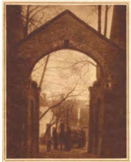
Afb. 2 De toegangspoort van Oudaen was in de jaren '20 nog intact. Nu resten slechts delen van de twee zijmuren. Uit: Utrecht in woord en beeld, z.j.