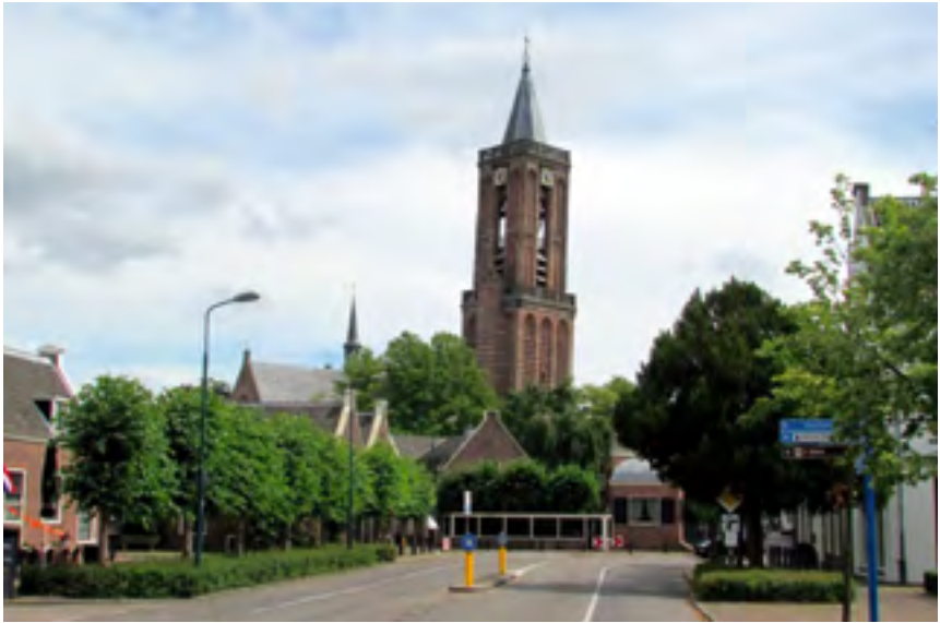
Afb. 1 Toren van de oude kerk van Loenen, gezien vanuit het noordwesten.

bakstenen getuigen van veel reparatiewerk door de eeuwen heen. Nu is een deel vervangen door gewapend beton met trekstangen erin die onder de toren doorlopen en op spanning zijn gezet. Door het beton zijn met diamantboren gaten geboord waardoor stalen buizen met schroefdraad zijn ingebracht die 17.50 meter diep tot op het zand zijn ingetrild. De kerkmuur is eveneens opgevangen aan beide zijden van de toren door aan weerszijden ervan beton op palen aan te brengen met stalen verbindingen ertussen. Totaal zijn er 52 buizen van 25 cm \varnothing gebruikt die met hun wapening en speciaal beton gevuld de dragende functie van het fundament hebben overgenomen. Zij staan op een dikke zandlaag.