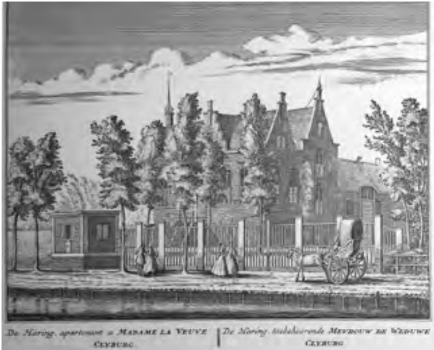
Afb. 14 De Haring te Baambrugge, plaat nr. 91 Hollands Arcadia , 1730.

van het dorp Nigtevecht was ooit een rij buitens te bewonderen te beginnen met Roosendaal , dan Swaanties en Overdam 38 met Zwaanwijck als enig overgeblevene. Aan de Reevaart was het Voordijk 39 dat Nederhorst-dorp allure gaf en aan de oostoever het kleine Damvecht . 40 Ook Vecht en Bergzicht , 41 alias Klemansplaats , lag eens aan de Hinderdam. Wat verderop waren het Damzigt en Overnes met aan de overzijde Schaapendoorn 42 die de aandacht trokken. Nog aan het einde van de 18 de eeuw kwam Koningslust met Hinderrust 43 aan de westoever naast fort Hinderdam tot stand. Onder Weesp lag Vegtzicht aan de oostzijde, waar ook Vechtwijk 44 heeft gelegen. Ten noorden van Weesp aan de westoever ligt de boomrijke begraafplaats die in de plaats is gekomen van het kasteelachtige 17 de -eeuwse Landskroon (afb. 13). 45