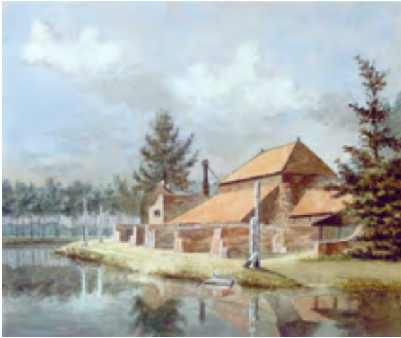
Afb. 4 Steenoven van Cromwijck te Maarsssen. Let op de rolpalen voor geleiding van de jaaglijn van de trekschuit. Aquarel van Nicolaas Bastert uit ca. 1880. (Coll. Teylers Museum)

sen in 1672 verwoeste huis. De betovergrootvader van de bekende Vechtschilder Nicolaas Bastert (1854-1939) kwam in 1757 op het huis en zette de steenfabriek voort (afb. 4).