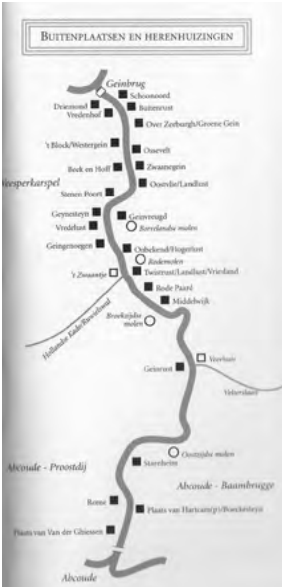
Afb. 16 Kaart van het Gein ten noorden van Abcoude met aangegeven de plaats van de verdwenen buitens. Het Gein Levensloop van een rivier , redactie Marijke Carasso-Kok, p. 93.