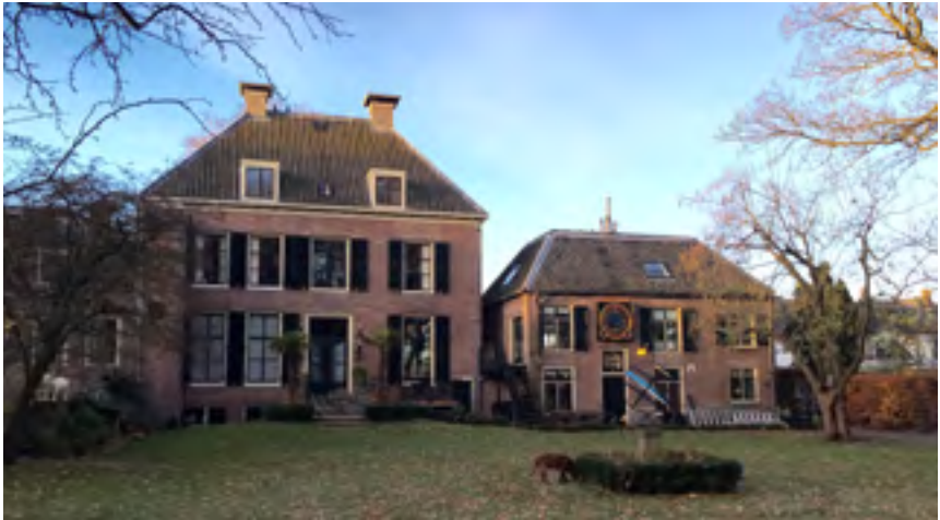
Afb. 1 De achtergevel van het huis Zuylenburgh en het koetshuis.