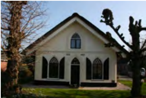
Afb. 6 Boerderij Boomoord voorheen behorend tot het buiten Boomoord te Breukelen aan de oostoever van de Vecht.

buitenplaats. Men vindt het een viertal huizen verder noordwaarts terug, rug aan rug met het buitentje Nieuw Hoogerlust .