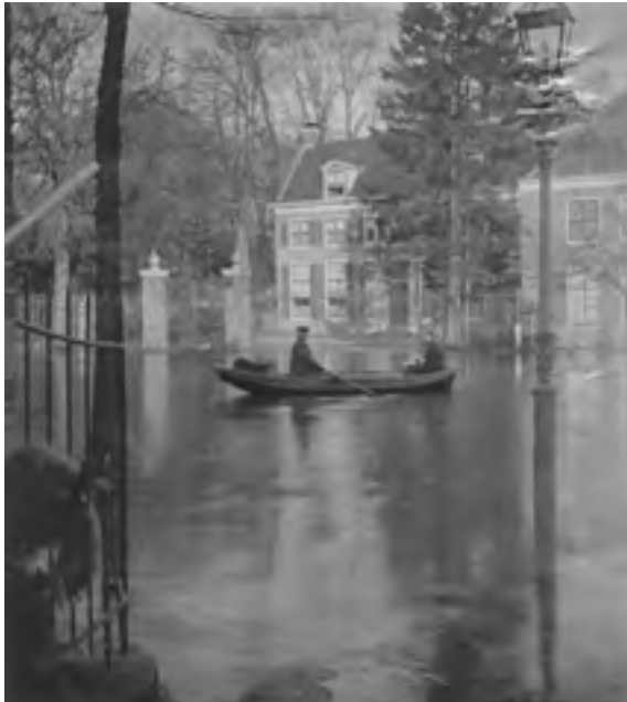
Afb. 7 Overstroming van de Vecht in 1928 met zicht op Raadhoven te Maarsse.

Wat verder langs het Zandpad ligt een weiland met een wat hobbelig oppervlak, een teken dat het deels afgeticheld is. Er staan enkele betonnen groepschuilplaatsen uit 1938 op zoals die op veel plaatsen langs de Vecht zijn te vinden. Zij zijn onderdeel van de Nieuwe Hollandse waterlinie. Eén van de betonconstructies was een geschutstelling waarin een zwaar kaliber mitrailleur in een gietstalen koepel kon draaien. De Duitse bezetter heeft die er met explosieven uit verwijderd.