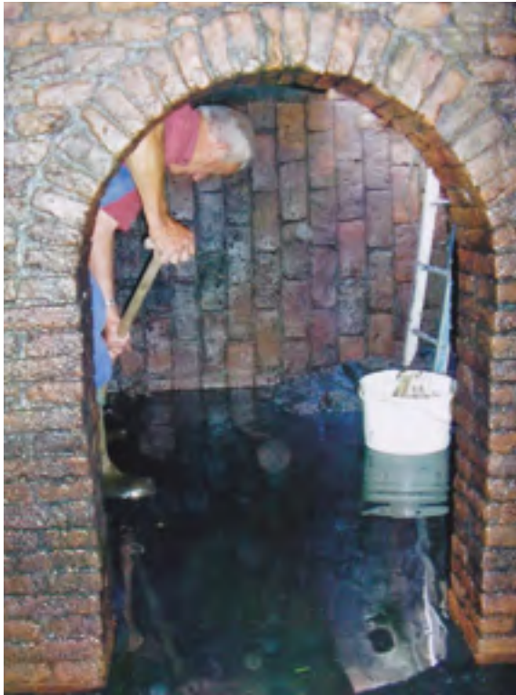
Afb. 22 Waterkelder van huis Doornburgh.

te tonen hoe een brand met zijn spuit aangepakt kon worden (afb. 20). In de tekst wordt er ook op gewezen dat men er gewassen en jonge bomen mee kan besproeien. Na afbraak van de boerderij is er een groter buitenhuis gebouwd en na afbraak daarvan is in 1754 het nog bestaande pand tot stand gekomen.