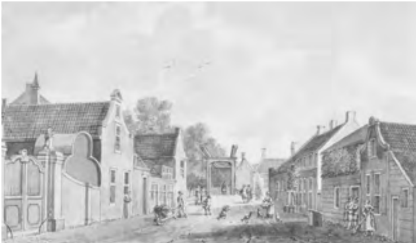
Afb. 27 De Kaatsbaan te Maarsse rond 1770 ziende naar de Vechtbrug.