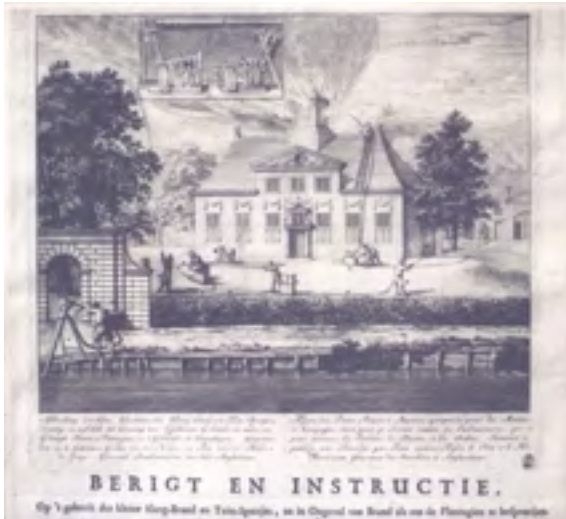
Afb. 20 Goudestein als voorbeeld hoe een brand met de brandspuit kan worden gelust. Prent door uitvinder Jan van der Heyden.

2009), maakte van het verval een aan duidelijkheid niets te wensen overlatend schilderij (afb. 18). Bij de ruiming kon de Historische Kring Maarssen archeologisch onderzoek doen en werd een beerput gevonden waarin onder meer een worstloodje werd aangetroffen met in Hebreeuws schrift het woord 'kosher'. Zoals bekend woonden in de 17 de maar vooral in de 18 de eeuw veel joden in Maarssen en mogelijk dus ook op Endelhoven .