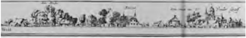
Afb. 3 Gezicht op de oostelijke Vechoever ten zuiden van Maarssen met buitens van Aux Brébis en Be(l)mont(e) en de steenfabriek van Van der Graef.

de Kaapse gouverneur Swellengrebel. 3 Naast dit buiten lag toentertijd het buitentje Ravensberg .