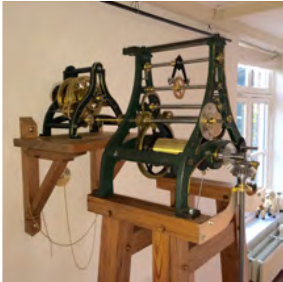
Afb. 4 Binnen in het koets- huis, op de eerste verdieping, bevindt zich de aandrijving van het uurwerk.

onder de zonnewijzer door en schuift dus een stip per dag op. Voor het gemak van het aflezen is iedere vijfde stip wat groter. Onder de zonnewijzer kan men de datum, de maand en het teken van de dierenriem waarnemen.