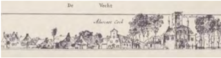
Afb. 28 Huis ten Bosch (Cromhout) op de gravure van de oostoever van de Vecht.

1903 ingenomen door het park van Huis ter Meer dat in dat jaar is afgebroken. Het was het meest paleisachtige huis dat ooit langs de Vecht is verrezen met de eveneens meest uitgebreide park aanleg.