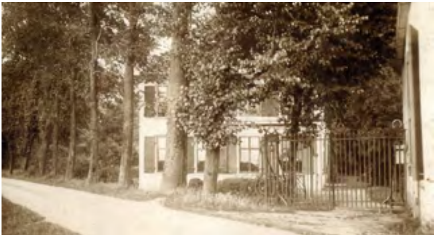
Afb. 14 Geesbergen te Maarssen circa 1900 met het hek dat later als betonwapening is gebruikt.