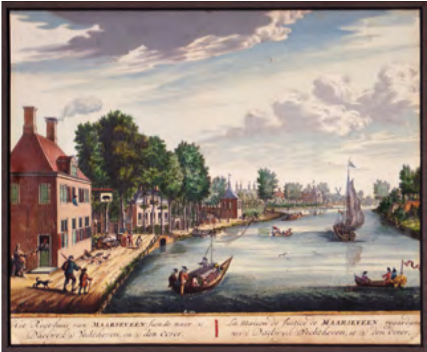
Afb. 15 Herberg Het Swarte Varken, rechthuis van Maarsseveen met over de brug Daelwijck en Vechthoven, in het verschiet Den Oever. (Plaat 17 in De Zegepraalende Vecht uit 1719)

(afb. 9) en een 18 de -eeuwse tuinvaas in Delfts blauw naar voorbeeld van plaat nr. 26 in De Zegepraalende Vecht uit 1719 (afb. 10). 4 Van 1947 tot '83 was Gansenhoef in gebruik als kindertehuis voor jongens en meisjes, Stichting Wilhelmus van Nassauwen, die werd beheerd door de Gereformeerde Vereniging tot Opnemng en Verzorging van Wezen of Verlatenen in het Geuzengesticht, opgericht in 1873 in Den Briel. Vanaf 1983 is het weer particulier bewoond.