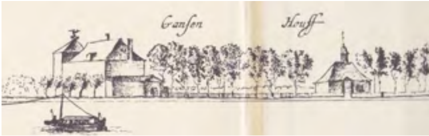
Afb. 8 Deel van de gravure met het oudste huis Gansenhoef te Maarsssen.

brengen om een gemaal in Muiden gefinancierd te krijgen. Dat kwam al eind 1929 tot stand met medewerking van opdrachtgever ir. A. Mussert, toen hoofd-ingenieur van Provinciale Waterstaat van Utrecht. Ja dat was de latere voorman van de NSB. Twee jaar later kwam overigens de Afsluitdijk klaar waardoor het gemaal nauwelijks meer gebruikt is.