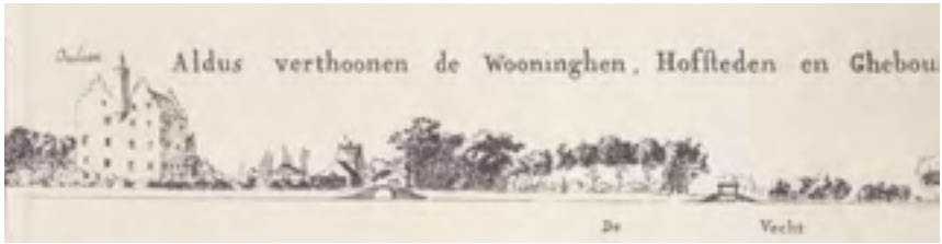
Afb. 1 Oudaen op de gravure van de oostoever van de Vecht.