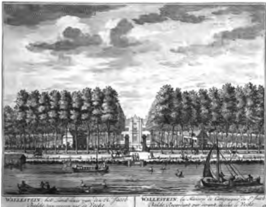
Afb. 9 Wallestein te Loenen, plaat 70 uit De Zegepraalende Vecht 1719. (Coll. auteur)

apart verkocht en is daar weer een nieuwe buitenplaats ingericht die de naam Ruygenhoff nieuw leven inblies.