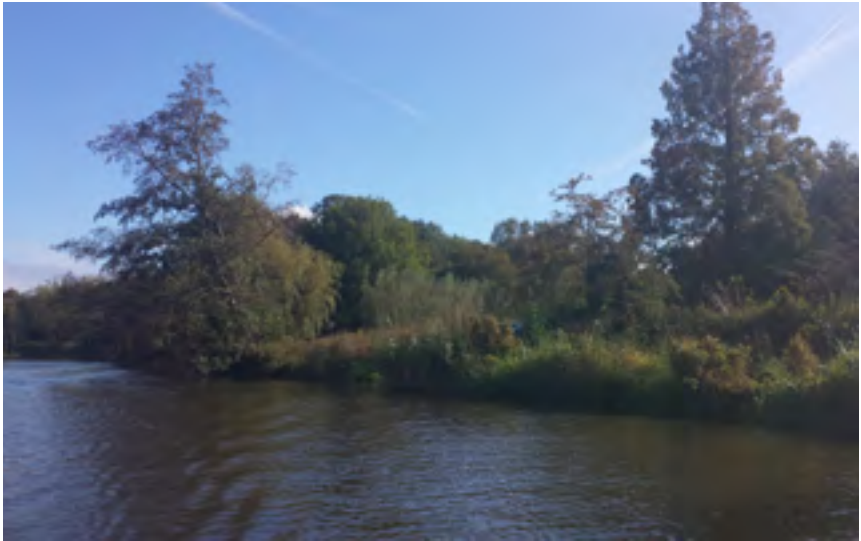
Afb. 1 Oeverlandje ten noorden van de Glashut aan het Oud Over te Loenen.

goede handen te krijgen. Per 1 januari 2017 zijn ze ondergebracht in de NNN (vroeger EHS).