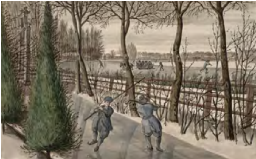
Afb. 13 De sloot voor Hoogevecht met rechts op de achtergrond Geesbergen en tussen de bomen Spruytenburg. Uiterst links het toegangshek van het buiten. Tekening door Abraham Rutgers en Ludolf Backhuysen, circa 1680. (Coll. Albertina Wenen)