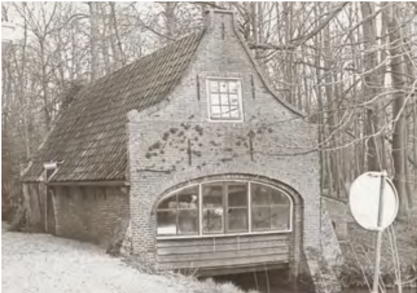
Afb. 21 Het, zeldzame, bakstenen 18 de -eeuwse botenhuys van Elsenburg in de jaren 70. Later is het tot woonhuis verbouwd.

De schilder-uitvinder Jan van der Heyden maakte van de verschillende buitens van de familie schilderijen. Hij was ook de uitvinder van de brandspuit, een enorme verbetering van de tot dan toe gebruikelijke mensenketting die emmers water doorgaven vanaf sloot of gracht. Om zijn uitvinding aan de man te brengen gaf hij bijgaande prent uit waarop Goudestein als voorbeeld staat om